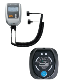
超音波骨折治療器 「アクセラス」「アクセラスmini」