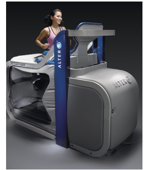
反重力トレッドミル「AlterG」