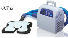
アイシングシステム 「CE4000」