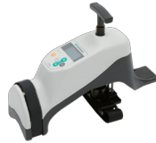
十字靭帯機能検査機器 「KS Measure」