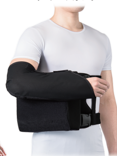
イージースリング