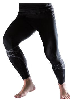
New! Neomotion ACL